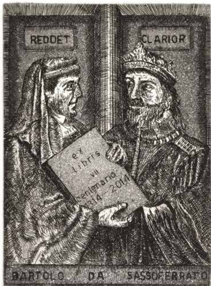
Renato Coccia, Incontro con l'imperatore Carlo (opus 325/maggio 2013) Tecnica mista su lastra di rame Parte incisa: 130x47 mm