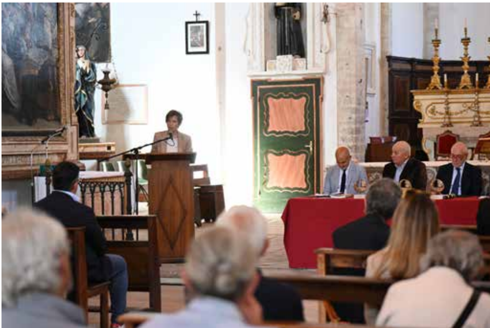
Interno della Chiesa di San Francesco