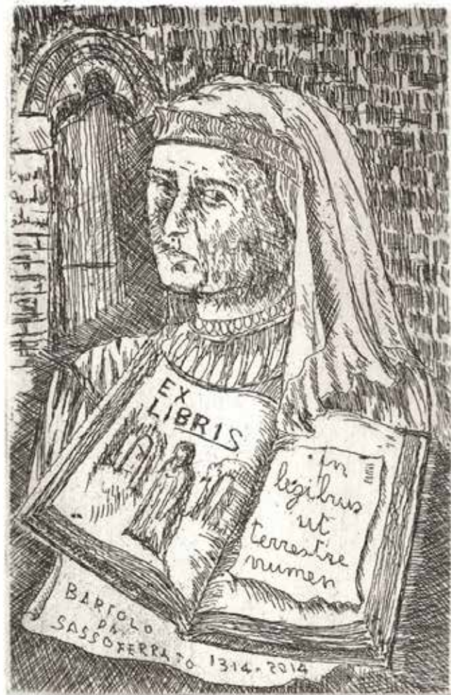
Renato Coccia, Bartolo da Sassoferrato (opus 327/2013) Acquaforte su lastra di rame Parte incisa: 82x54 mm