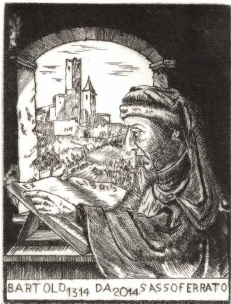
Renato Coccia, Studio e meditazione (opus 232/2013) Puntasecca su materiale plastico Parte incisa: 129x99 mm