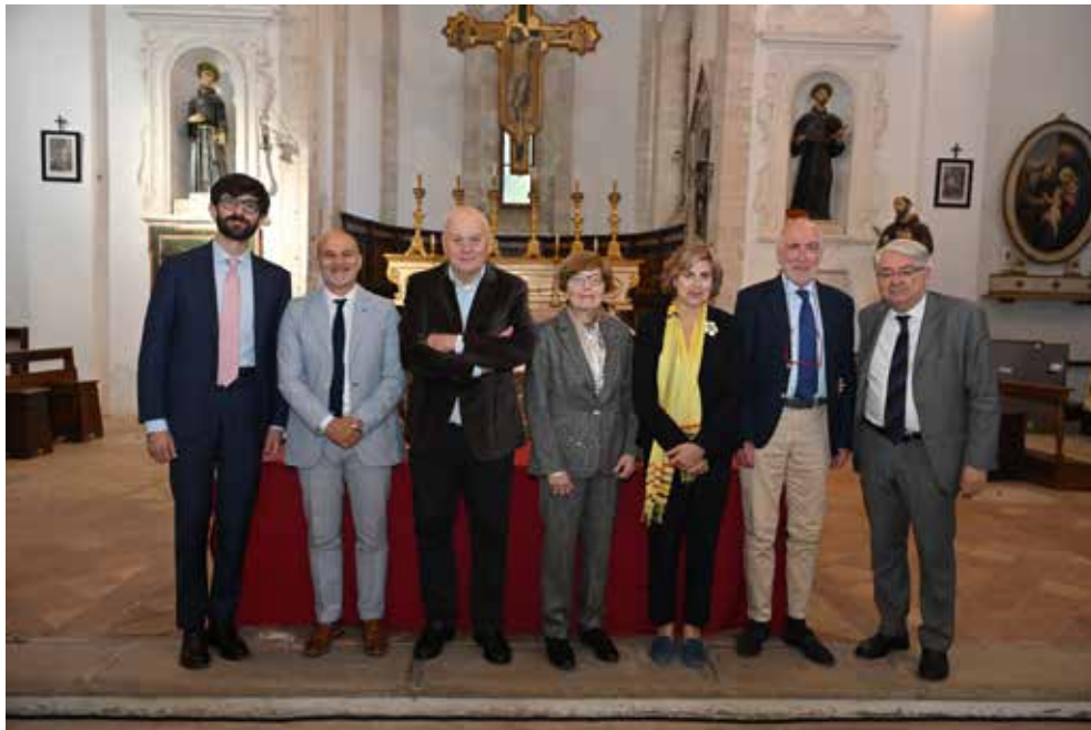
Premiati e Membri della Giuria