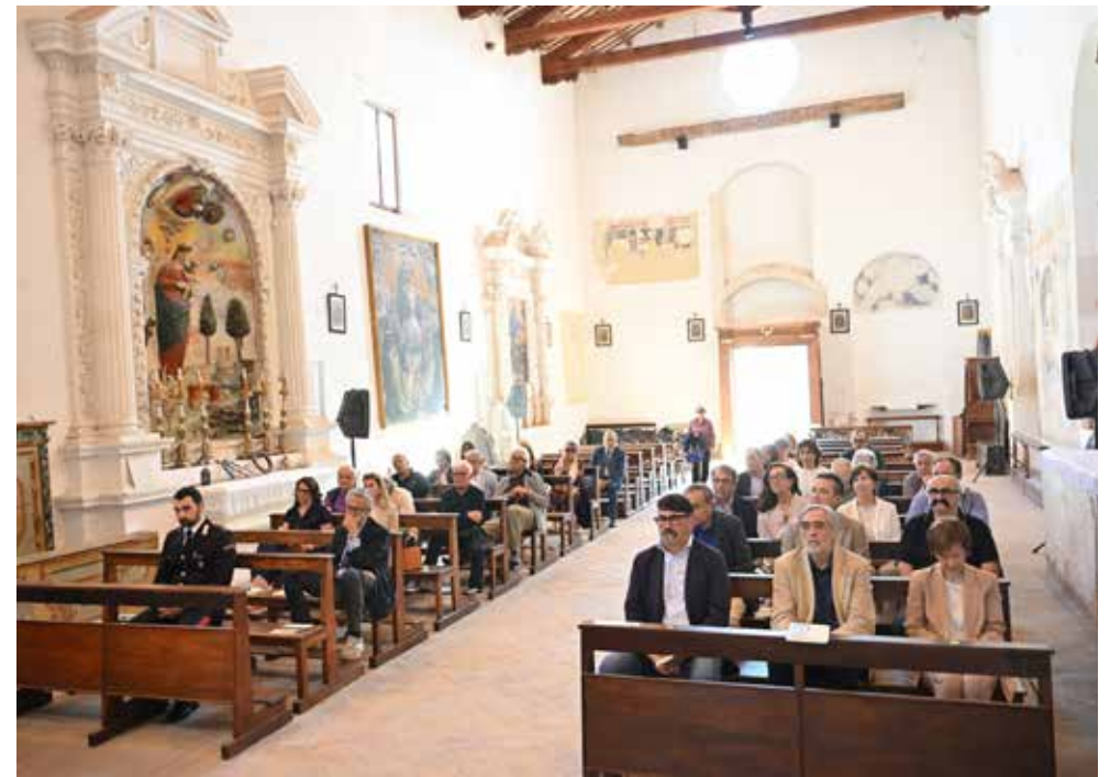
Interno della Chiesa di San Francesco