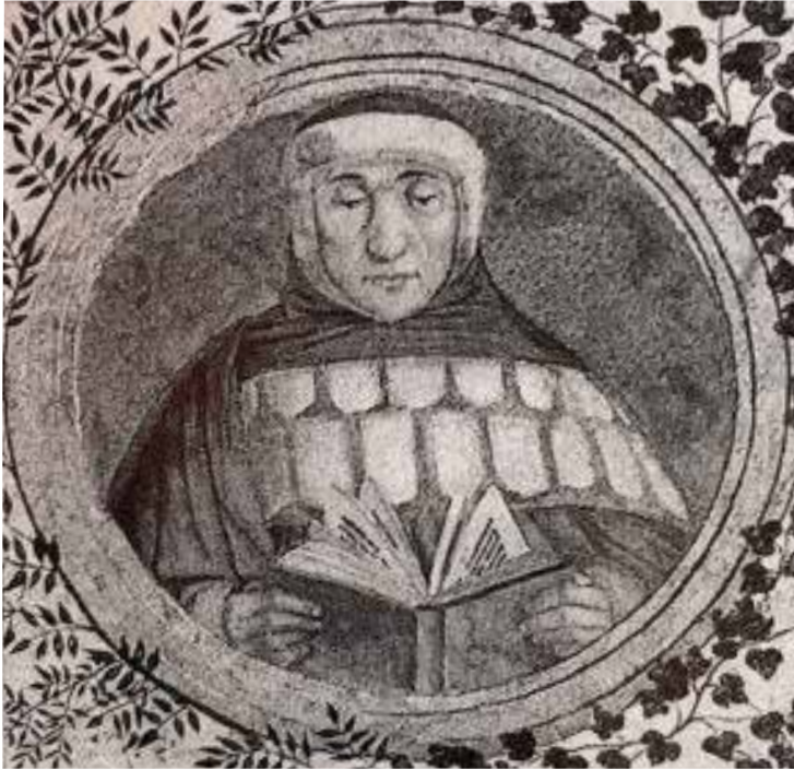
Anonimo umbro, Ritratto di Bartolo da Sassoferrato , Perugia, Palazzo Murena, 1535, 300x285 mm